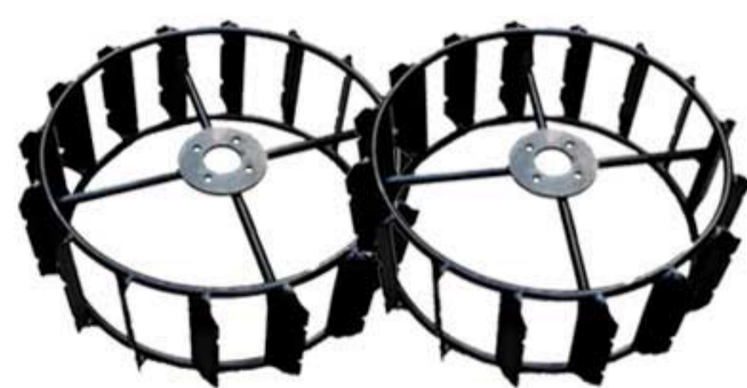
Roda besi (lahan berair / sawah)