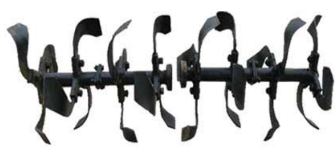
Axle Rotary Blade / Pisau Rotari Axle