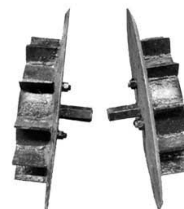
Roda besi (Lahan jagung)

Untuk kepentingan perbaikan mutu mesin, hasil produk dan perkembangan kemajuan teknologi, spesifikasi dan dimensi dapat diperbarui. The product are subject of continous development and as result, their specification and dimension may change and differ in detail from those shown.